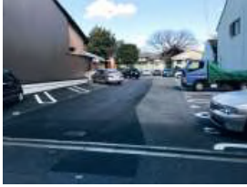
駐車場入り口写真