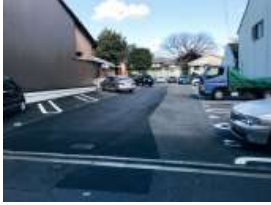
駐車場入り口写真